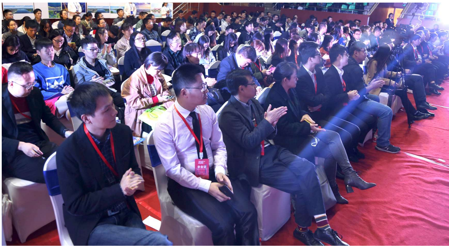
专场活动座无虚席

在项目路演环节,双方紧紧围绕工业自动化、智能精密制造、军民融合等主题进行交流探讨,5家企业代表分别做项目交流展示。通过此次活动,与会代表建立了紧密的联系,并表示了强烈的战略合作意愿。