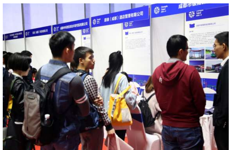
新区招聘单位吸引着青年学子