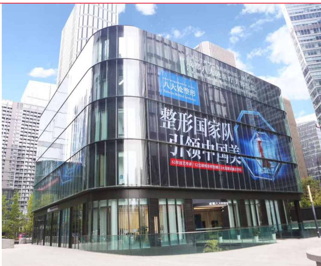
成都八大处医疗美容医院

据天投金控公司相关负责人介绍,这一项目是公司布局大健康产业链的第一步,合作主要以股权投资为主,未来天投金控公司将整合金融链、产业链、创新链等资源打造天府新区大健康产业。“我们有严格的投资标准,只有社会效益与经济效益并重的项目,才会被纳入考核范围。”天投金控公司的相关负责人透露,目前,公司正在跟省市及国家级的医院、健康产业机构对接,探讨将各类优质医疗资源引入新区。